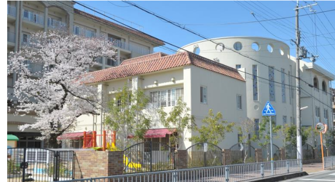
社会福祉法人 友朋会